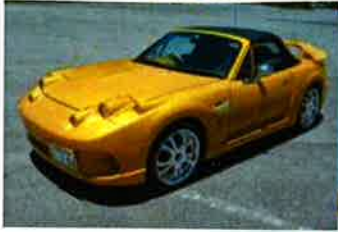
オリジナル デザインカー