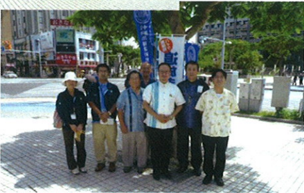
無保険バイク追放キャンペーン 那覇市久茂地 パレット前 7名がチラシ配布