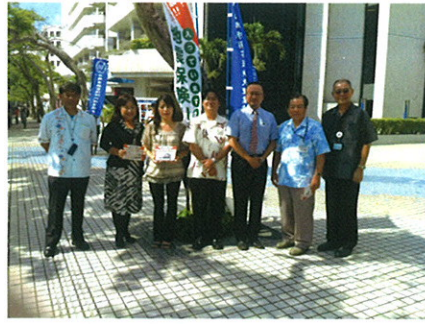
地震保険キャンペーン 10月24日 那覇市久茂地 パレット前 7名がチラシ配布