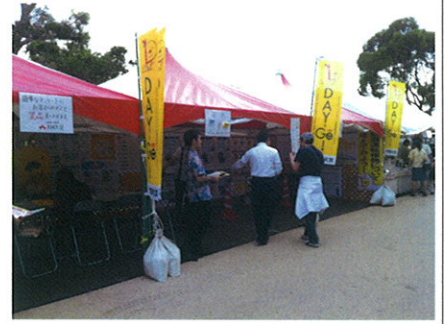
産業祭り 10月24日 (奥武山公園) 大同火災ブースにて理事2名がチラシ配布