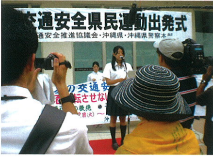
夏の交通安全県民運動出発式 (7月12日 沖縄県那覇市安里/さいおんスクエア前) 県環境生活部県民生活課より職員派遣依頼を受けて3名の理事が参加