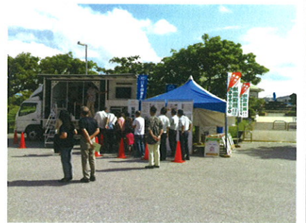
トータルリビングショー 10月21日～23日 (宜野湾市沖繩コンベンションセンター) ・起震車で地震の体験呼び掛け・チラシ配布 理事3名