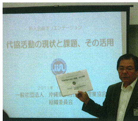
セミナー講師の大城会長