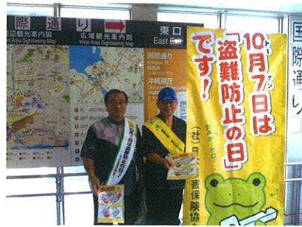
盗難防止の日キャンペーン (社)日本損害保険協会とタイアップしてチラシ配り 理事4名