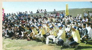
うるま市で開催されたビーチクリーンアップに参加