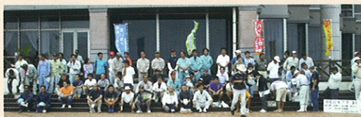
宮古島市で開催されたビーチクリーンアップに参加